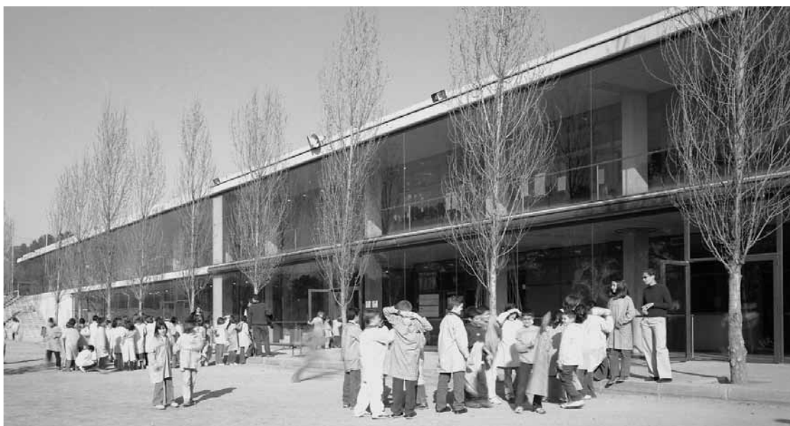
Façana interior escola.