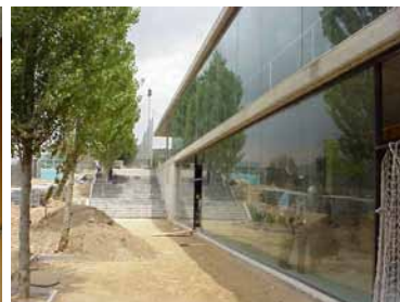
Tancaments interiors, passadís i façana interior.