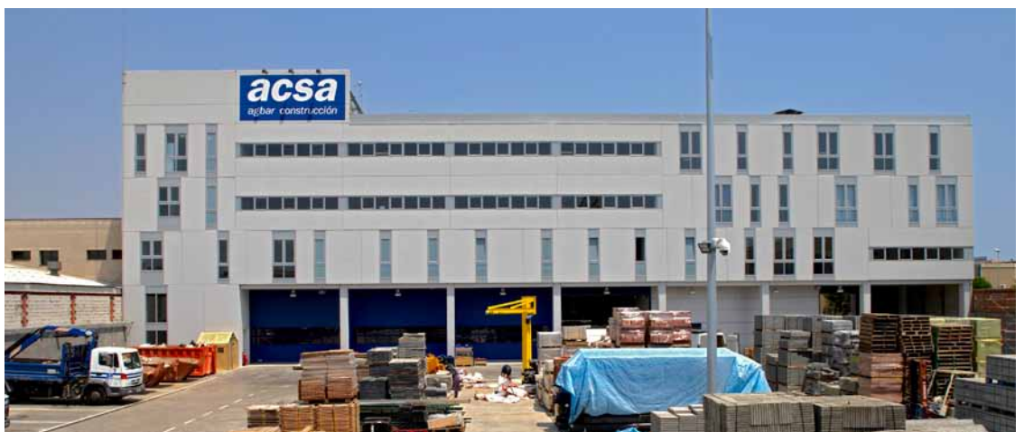
Façana pati interior.