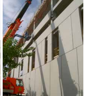
Muntatge estructura i façana.